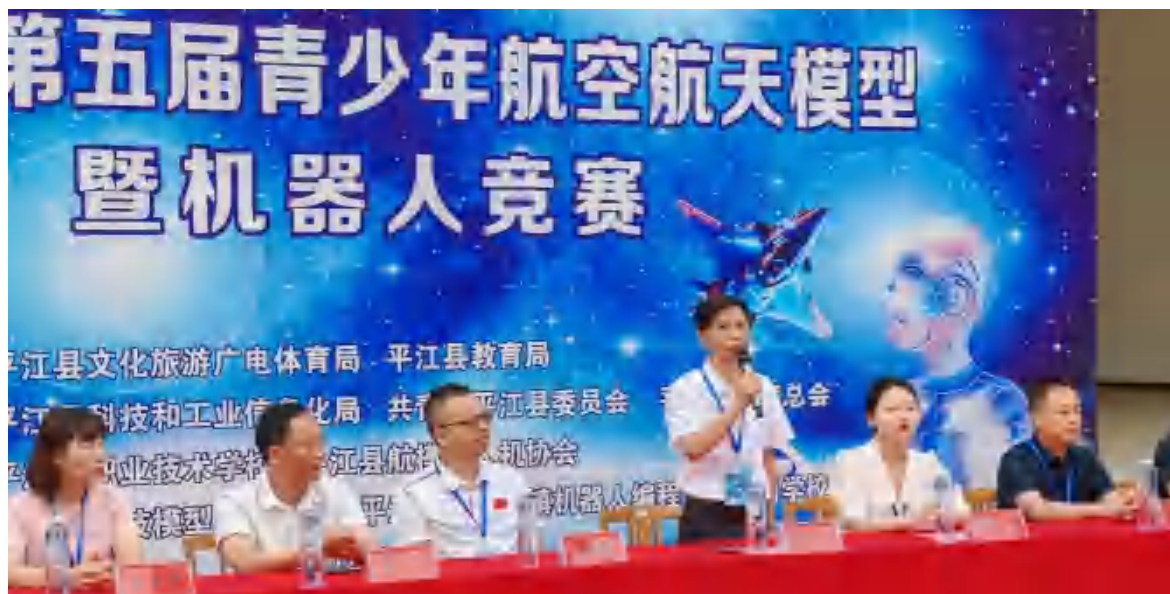
图7 航空航天暨机器人竞赛开幕式

在2025年平江县第五届航空航天暨机器人竞赛中，我校代表队荣获一等奖6个，二等奖7个，三等奖6个。