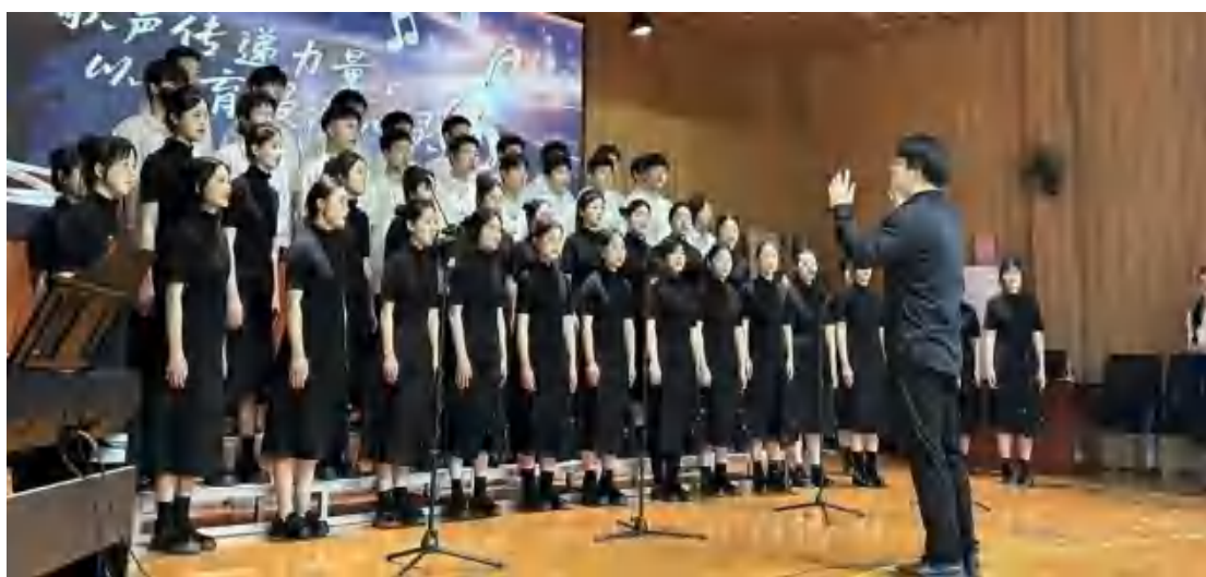
图16 校合唱团走进爽口中学现场

活动中，学校师生合唱团倾情演绎《青春舞曲》《Flying Free》等曲目，展现职教学子的艺术风采；互动环节设置音乐知识问答、全场合唱“音阶歌”、城乡师生同台演出等，打破观演界限，实现深度交融。活动在全场共唱《歌唱祖国》中推向高潮，凝聚情感共鸣，厚植家国情怀。