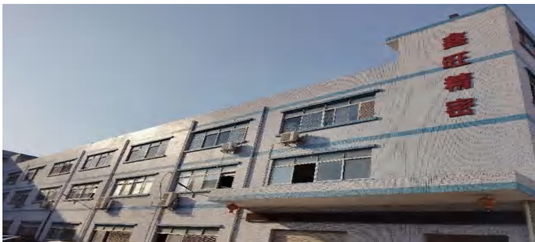
图85 对校内实训基地进行物联网升级