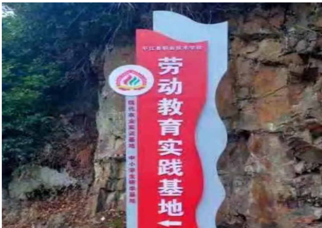
图25 学校劳动教育实践基地