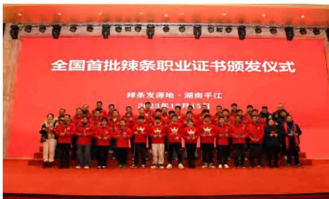
图78 全国首批辣条职业资格证书颁发仪式

话题阅读量 2.6 亿，形成产教融合 “平江样板”。学校获评老挝职业教育标准开发入围建设单位，相关标准与资源入选老挝国家项目，走向国际。未来将扩大招生，深化 AI 应用，推动考核标准升级。