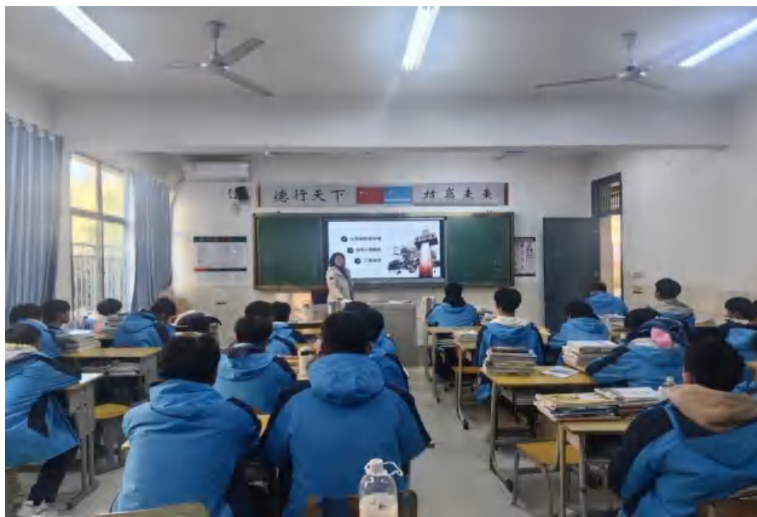
图5 “国家公祭日” 班会活动