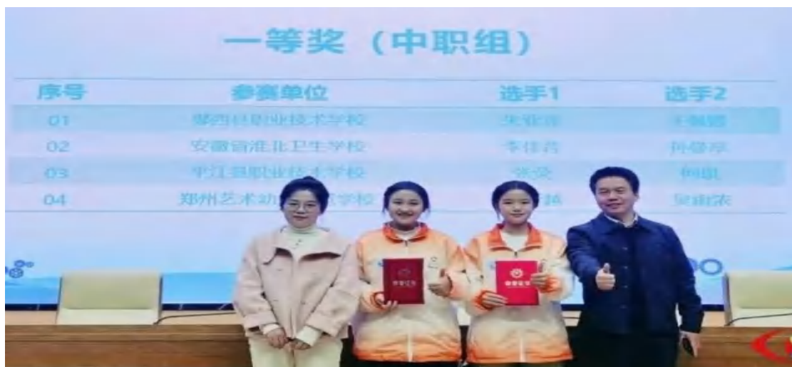
图46 “金砖大赛”获奖现场