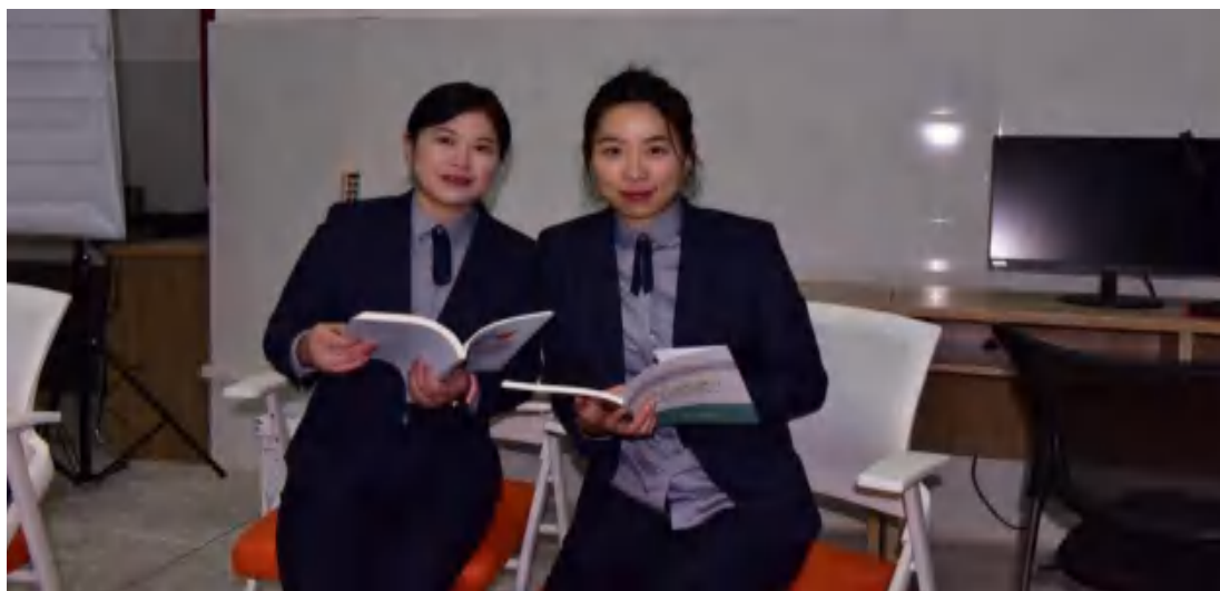
图43 《微信里的“大灰狼”》短剧录制现场

市技能竞赛: 2024年11月我校学生100人参加岳阳市中等职业学校学生技能竞赛。其中有短视频制作技术、零部件测绘与CAD成图技术、网络搭建与应用、电子商务运营、职业英语技能（2个）、酒店服务、钳工技术、沙盘模拟企业经营、艺术专业技能（钢琴）10个项目21人获一等奖，11个项目29人获二等奖，15个项目36人获三等奖。在各位的努力下，参赛选手获奖率86%，第9次蝉联全市团体第一名。