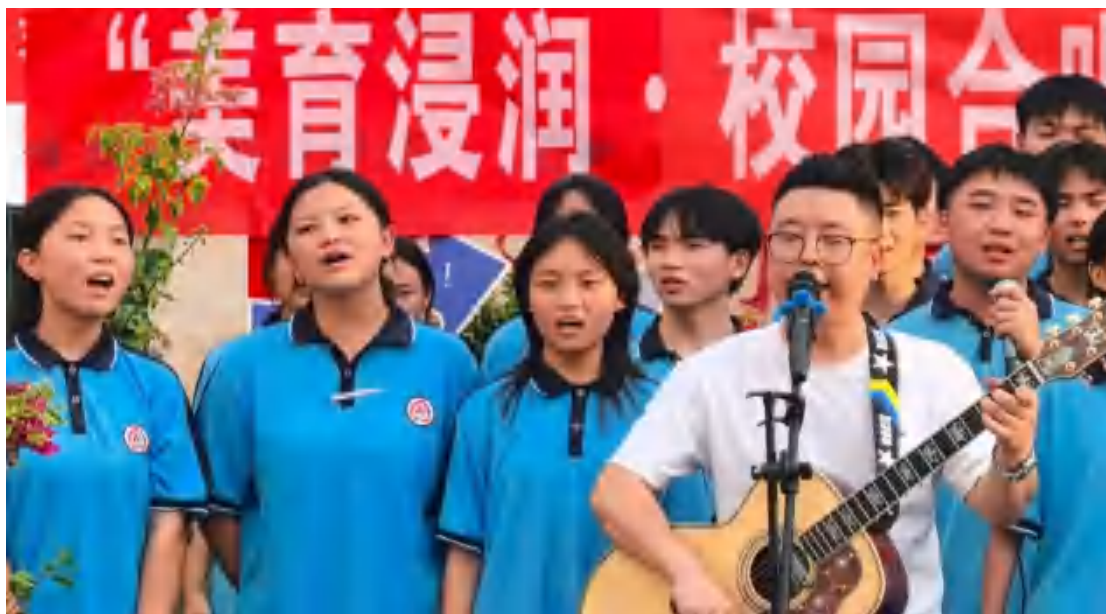
图17 美育浸润活动现场

舞蹈社短视频拍摄： 学校始终将美育融入教学与实践，坚持在课堂之外拓展学生的艺术视野，组织过程中，引导学生依据兴趣自主创编舞蹈，激发自信与艺术潜能。鼓励热爱舞蹈的学生进行短视频创作，共同拍摄了20部舞蹈作品，累计播放量突破200万。舞蹈与新媒体美育路径的结合是一次有效探索。