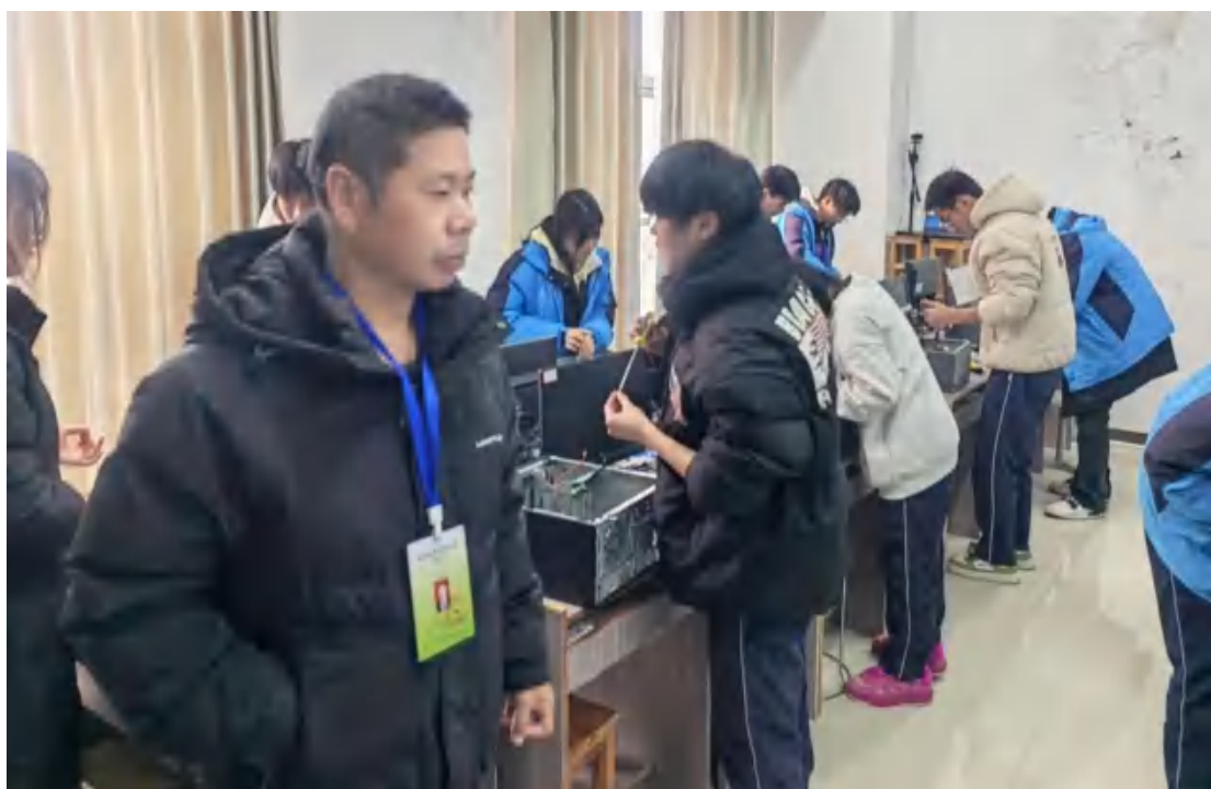
图 62 计算机整机装配调试员