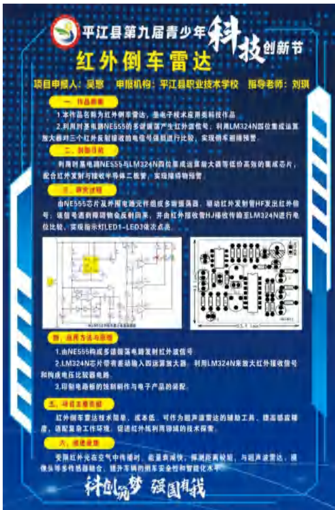
图12 学生创新设计作品