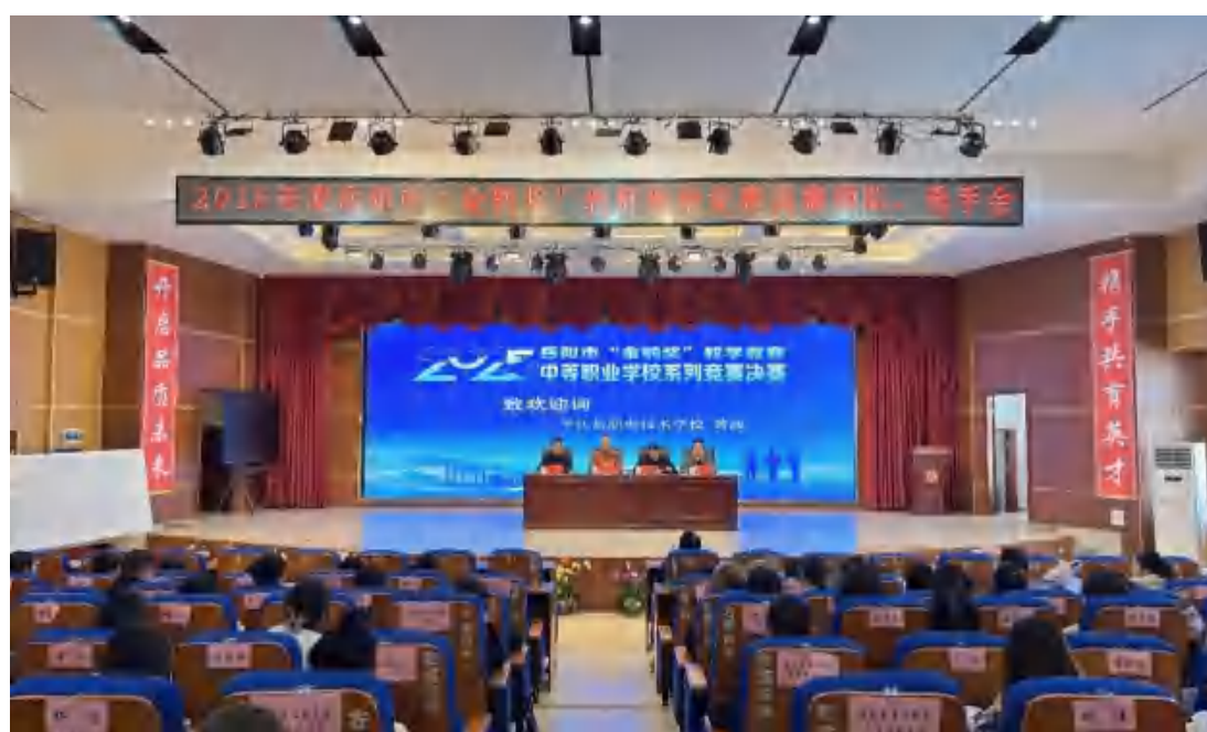
图29 2025岳阳市“金鸚奖”中职系列决赛