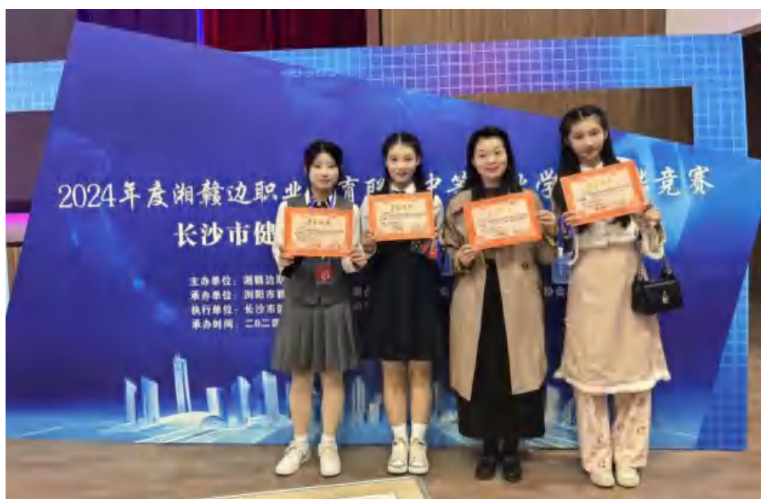
图42 湘赣边技能竞赛获奖师生合影

湘赣边技能竞赛： 2024年10月应邀参加浏阳市教育局举办的“湘赣边职业教育联盟第一届学生技能竞赛”，我校86名学生参加美术（景物素描）、电商直播等20个项目的竞赛，一共获得16个一等奖，25个二等奖，30个三等奖。获奖率达83%。