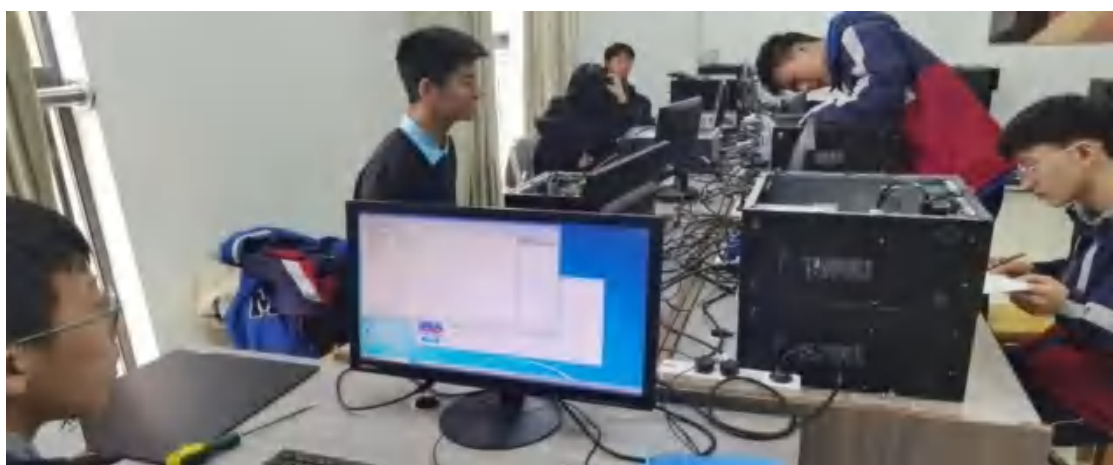
图82 母婴照护实训室