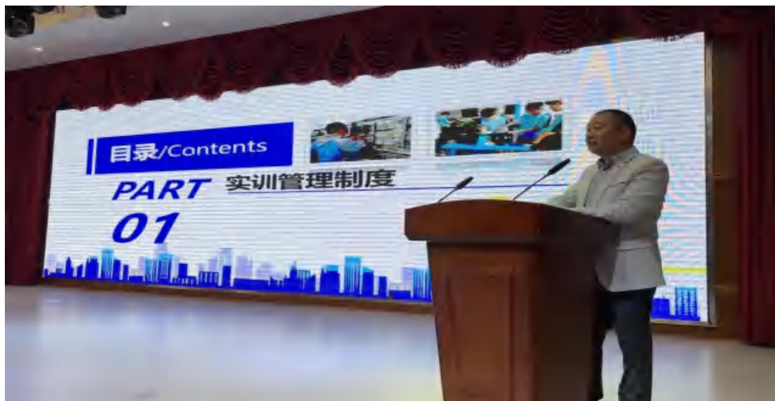
图32 实训处组织学习实训管理制度

功能室危险品、易碎品、特种设备排查。常态化开展安全教育课，通过这一系列的工作，实训教学过程中没有发生任何安全事故。