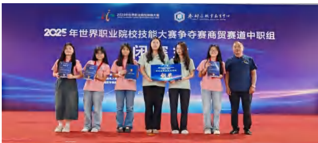
图50 企业经营沙盘模拟赛项荣获国赛“三等奖”

国赛： 2025年8月，我校在世界职业院校技能大赛总决赛争夺赛中，企业经营沙盘模拟（商贸赛道）和电子商务运营也双双取得三等奖。