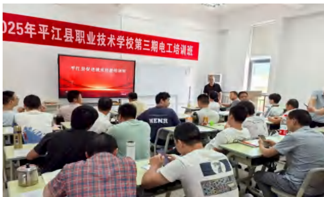
图 58 电工培训现场