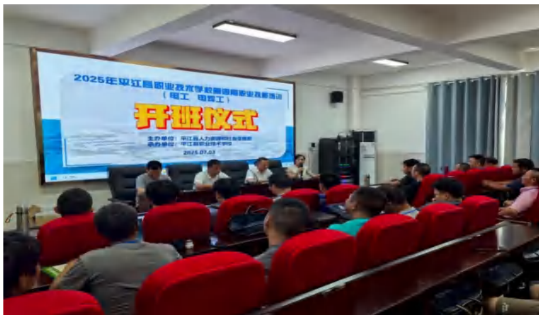
图57 电工培训开班仪式

实地走访、线上问卷等方式开展效果评估，学员职业技能水平与就业竞争力显著提升，为区域产业升级与乡村振兴提供了坚实的人才支撑。