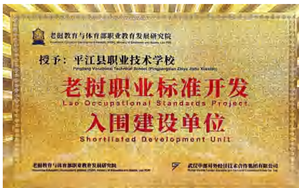
图79 老挝职业标准开发入围建设单位