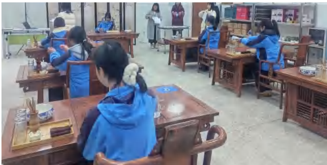
图 61 茶艺师鉴定现场

高级工及以上技能等级证书或中级及以上专业技术职务，且经上级主管部门备案；认定全过程实行音视频录像存档，试卷收发、成绩评定实行双人复核制，确保认定过程公平公正。