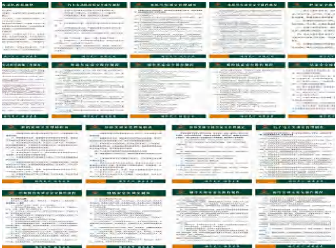
图33 实训室管理制度