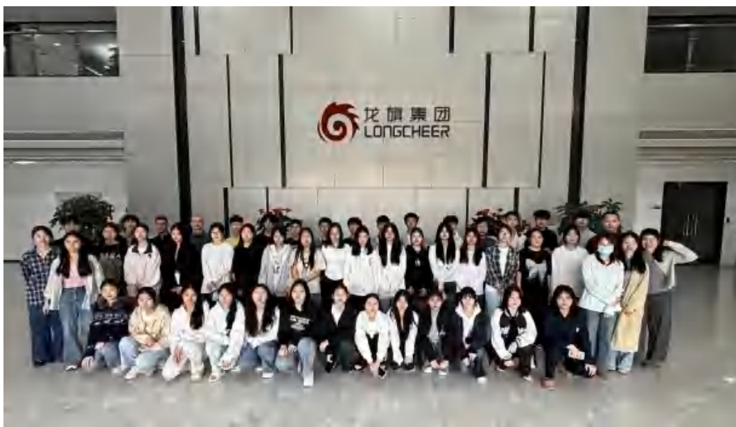
图 31 学生龙旗实习

2025 年，学校与合作企业持续深化校企协同育人。在实习实践方面，合作企业全年共接收实习学生 1613 人，较 2024 年的 2202 人有所调整，实习安排更趋集约与精准。在学生就业方面，合作企业直接录用我校毕业生人数显著提升，达 123 人，较上年的 72 人增长 70.8%，反映出校企合作在人才输送方面的实效进一步增强。