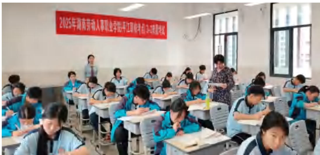
图 38 转段考试笔试现场

并建立多元化考核体系。合作培养的学生 100%转段升入高职院校，且在职业技能竞赛中屡获佳绩，如获湘赣边职业技能竞赛导游服务赛项二等奖等。