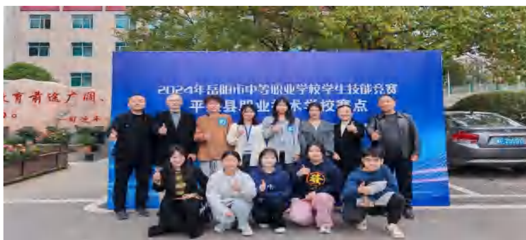
图44 市赛获奖师生合影

市技能竞赛: 2024年11月我校学生100人参加岳阳市中等职业学校学生技能竞赛。其中有短视频制作技术、零部件测绘与CAD成图技术、网络搭建与应用、电子商务运营、职业英语技能（2个）、酒店服务、钳工技术、沙盘模拟企业经营、艺术专业技能（钢琴）10个项目21人获一等奖，11个项目29人获二等奖，15个项目36人获三等奖。在各位的努力下，参赛选手获奖率86%，第9次蝉联全市团体第一名。