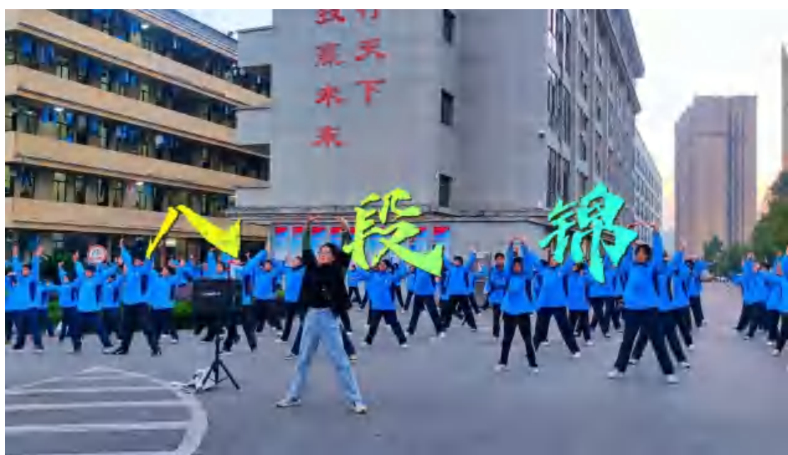
图70 师生练习“八段锦”