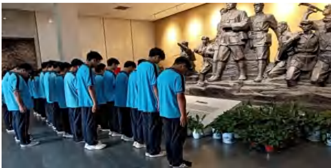
图74 部分团员缅怀先烈