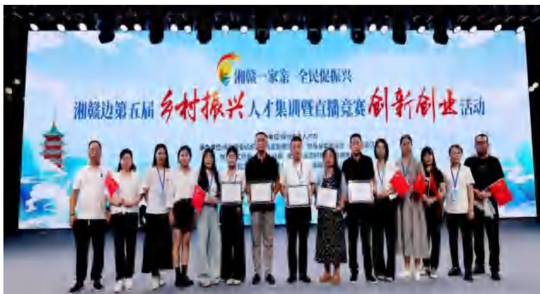
图56 湘赣边第五届乡村振兴人才集训暨直播竞赛颁奖现场