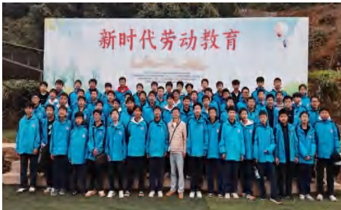
图22 学生劳动教育合影

学校将基地实践纳入教学体系，开发 “春播、夏管、秋收、冬藏” 动态课程，注重 “五育” 融合，渗透纪律安全、学科应用与审美创造教育。学校规定每班每学期至少有 2 次劳动集中实践，其中基地2025 年度接待 71 个班级、5800 人次，实现全覆盖。