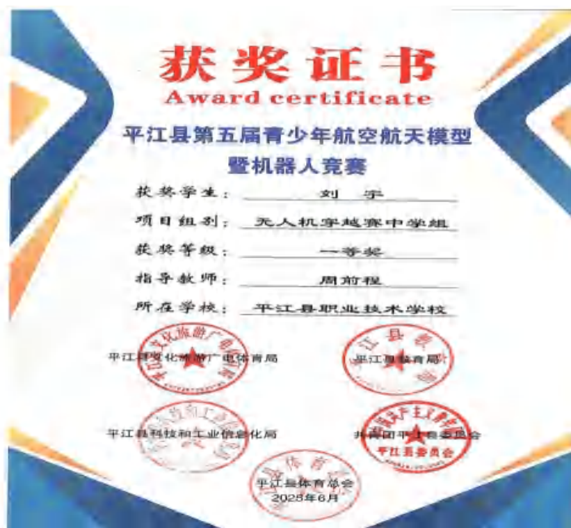
图8 无人机穿越赛中学组获奖证书