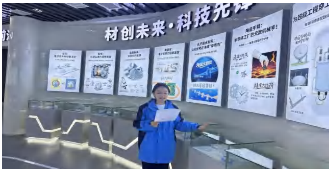
图63 思源实验小学组织学生来科技馆学习