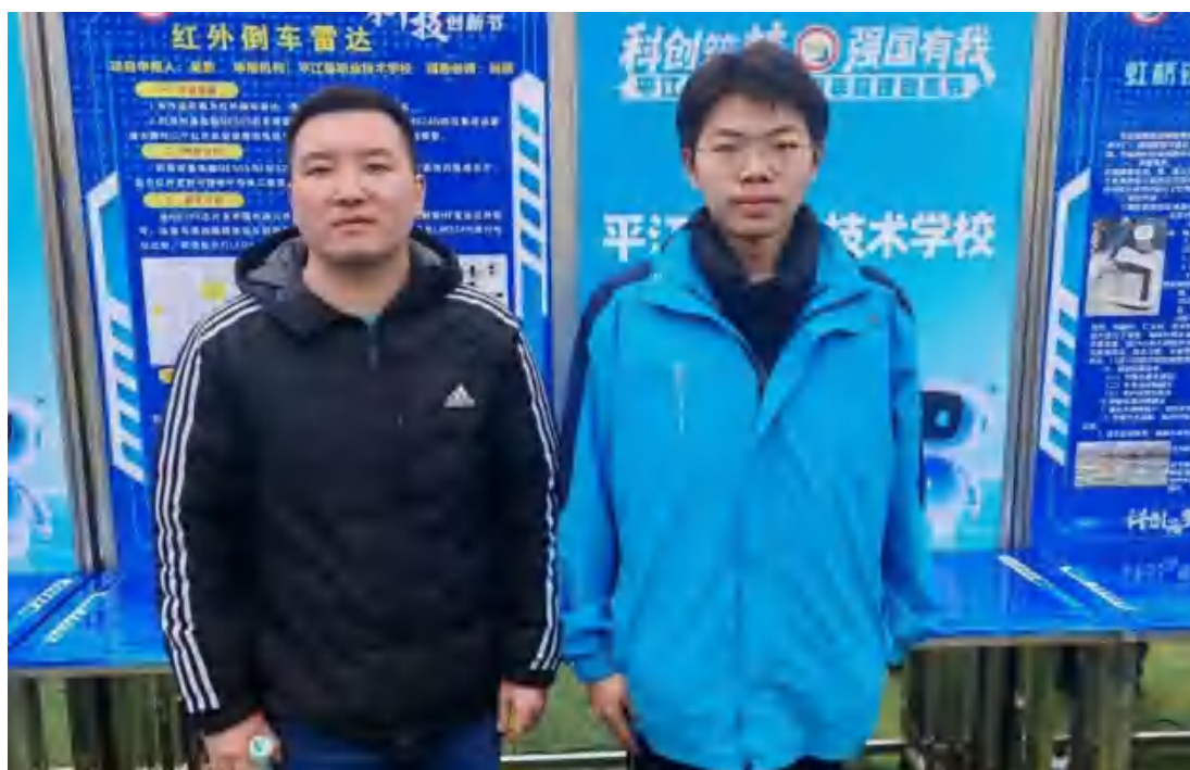
图11 创新设计比赛现场指导老师与学生合影

装置创新亮点突出：硬件架构极简，元件数量比超声波雷达方案减少 60%，调试便捷；可视化预警直观，三色灯组传递信息，减轻认知负担；场景适配灵活，可扩展用于仓储防撞、智能小车避障等。在校园科技节演示中，其 2-5 米测距误差稳定在 8% 以下，相关技术报告获市级科创比赛二等奖，已投入机器人社团日常训练。