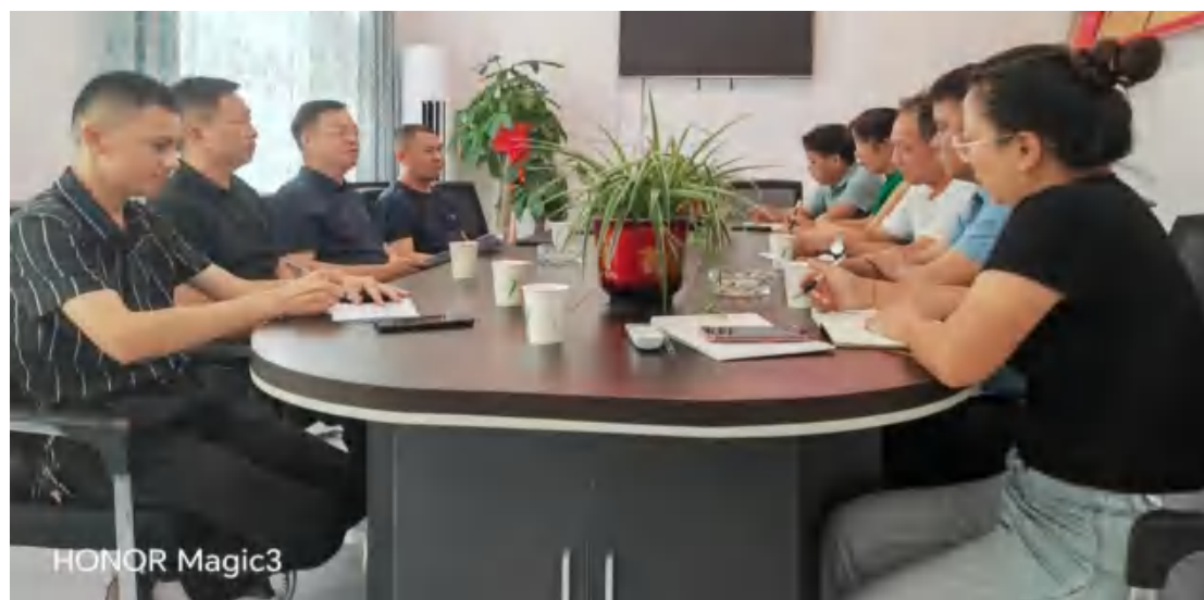
图53 驻村干部进行防溺水巡查

水渠硬化后，不仅满足了育秧大棚的日常灌溉需求，更打破了季节限制，为秋冬季反季蔬菜种植创造了有利条件。通过调整种植结构，村集体成功开展反季蔬菜种植，当年实现集体经济增收 4 万元，切实提升了村级项目的可持续运营能力与收益水平。