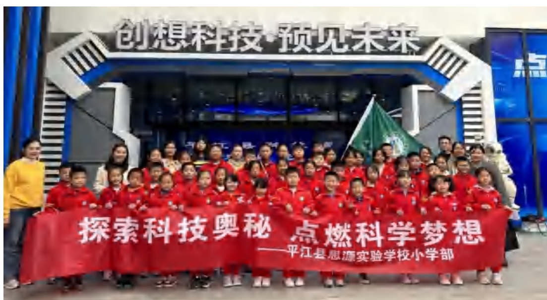
图64 旅游专业学生在科技馆讲解