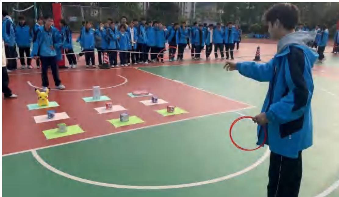
图77 金秋游园活动现场二