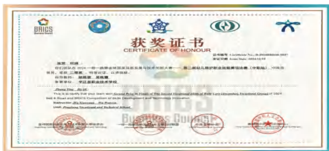
图47 金砖大赛学校获奖证书