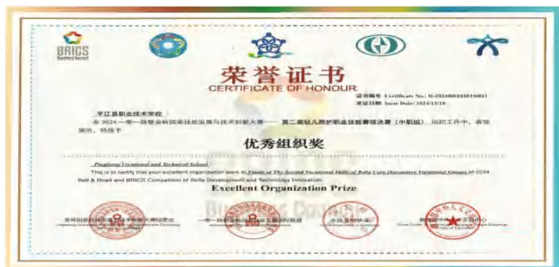
图48 金砖大赛学生获奖证书