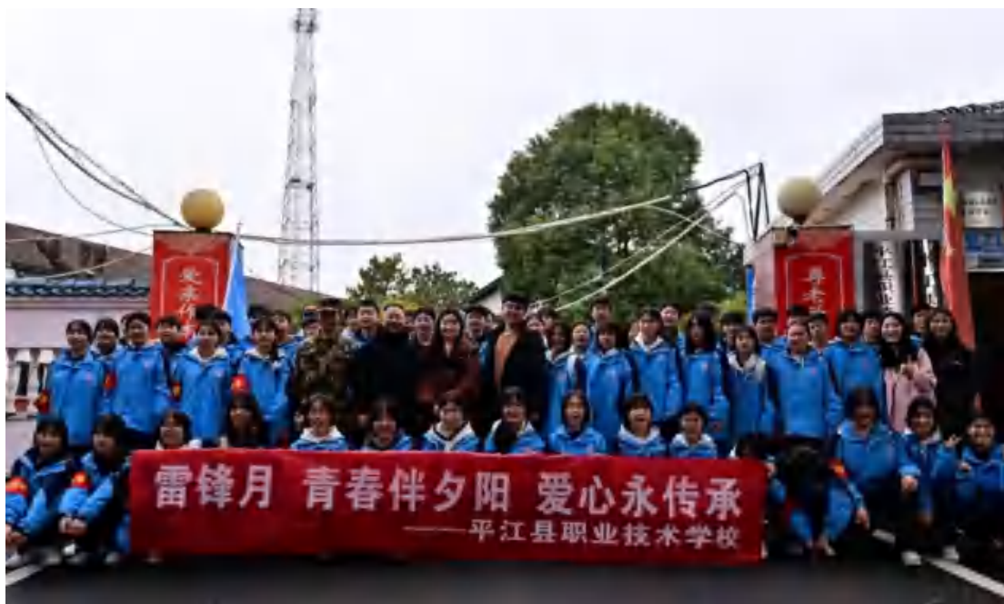
图3 三月“学雷锋”活动

本年度，以“塑形润心”为核心理念，学校德育体系的构建严格遵循全员育人、全面育人、全程育人的整体性原则。全员育人强调全体教职职工都肩负德育责任，形成育人合力；全面育人注重学生在品德、知识、技能、身心等各方面的全面发展；全程育人则将德育贯穿于学生在校学习、生活的全过程，实现从形入心、形神俱备地培养合格的劳动者。通过构建“塑形润心”德育体系，塑造学生良好的外在形象与行为习惯，滋润学生的心灵，培养他们积极向上的情感态度、正确的价值观和社会责任感，使学生成为具有良好职业道德、精湛专业技能和健康身心的高素质技能型人才。