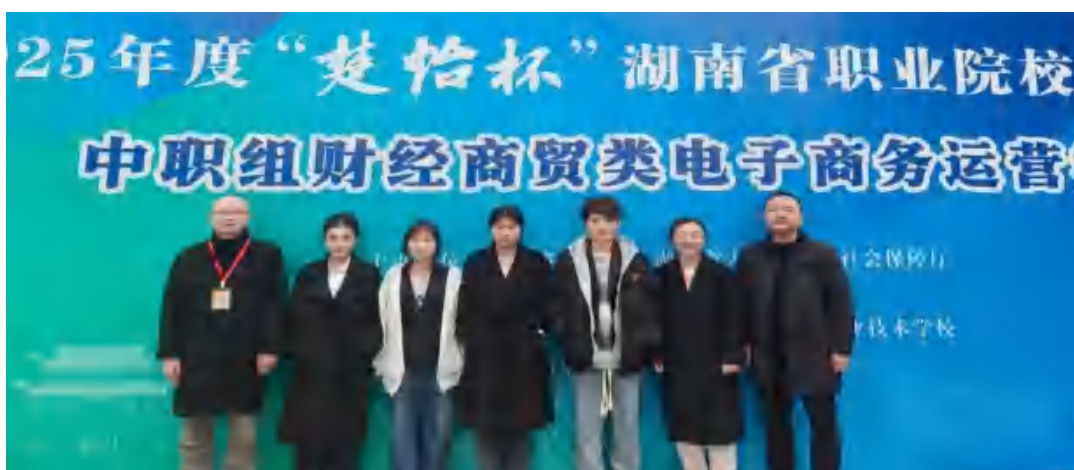
图49 电子商务运营省赛“一等奖”

省技能竞赛： 在2025年度“楚怡杯”湖南省职业院校技能大赛共获一等奖3个，分别是电子商务运营、婴幼儿保育省赛、企业经营模拟沙盘，二等奖2个，三等奖6个，再创佳绩。