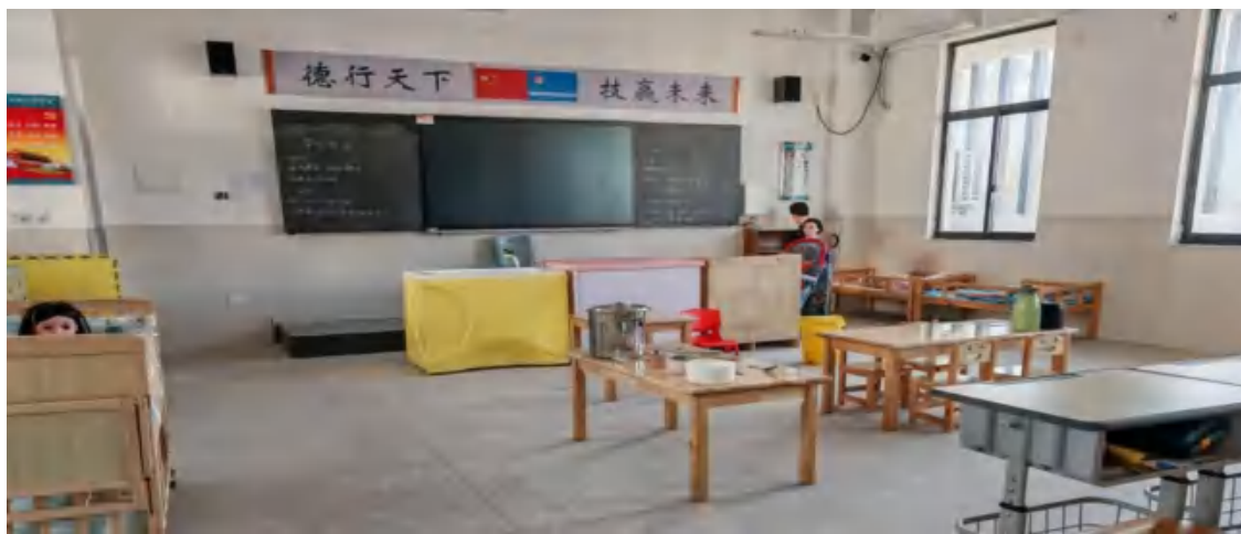
图81 计算机检测与数据恢复实训室

学校结合实际和“双优校”建设的需要，拨款212万元用于实训室改扩建，已完成产后恢复训练室、幼儿保育储藏室、母婴照护实训室、工业产品设计与创客实践实训室、计算机检测与数据恢复实训室、酒店服务与前厅实训室、美容美体专业实训室、钳工实训室、数控专业（机加圈）实训室、网络布线实训室、网络搭建与应用实训室、新能源汽车实训室等12个实训室的改扩建。