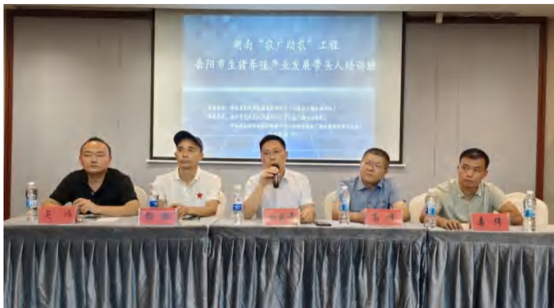
图60 养殖培训开班仪式