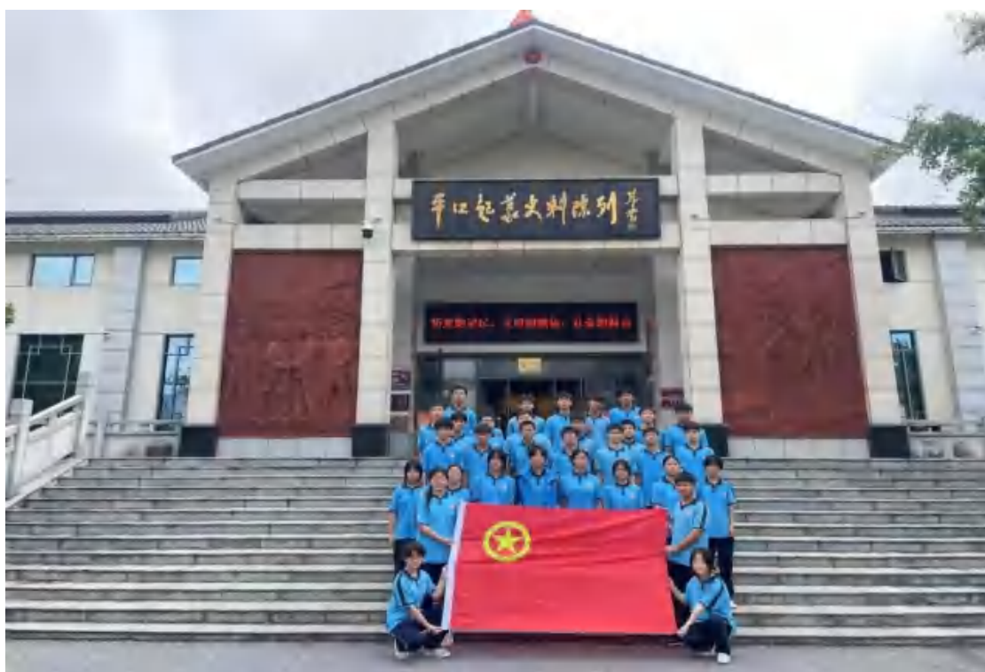
图73 部分团员在平江起义纪念馆前合影

学校全年开展了红色电影观后感征集、爱国主题校园广播专题宣传、电子屏影像展播等延伸教育，推动红色教育融入日常校园文化。通过公众号、官网等多渠道宣传，制作《红色足迹纪实》教学视频，形成“活动—宣传—反馈”教育闭环。