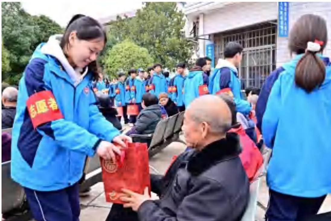
图4 敬老院看望老人