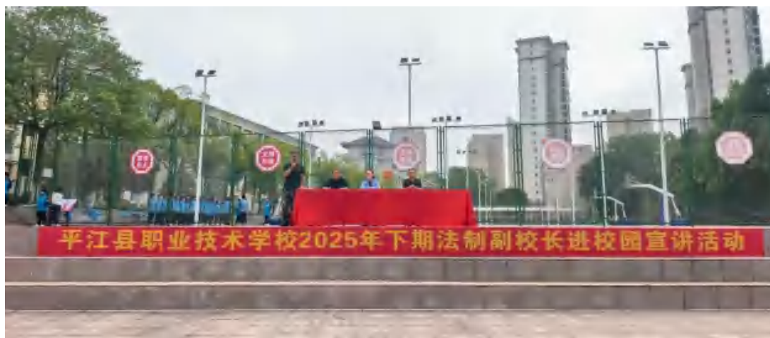
图97 法治副校长进校园宣讲