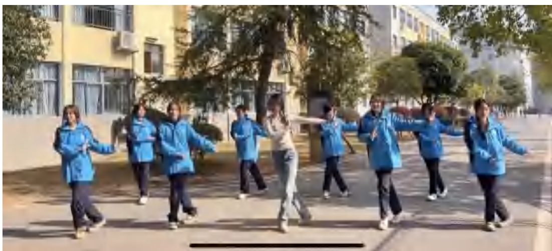
图18 校园短视频拍摄

舞蹈社短视频拍摄： 学校始终将美育融入教学与实践，坚持在课堂之外拓展学生的艺术视野，组织过程中，引导学生依据兴趣自主创编舞蹈，激发自信与艺术潜能。鼓励热爱舞蹈的学生进行短视频创作，共同拍摄了20部舞蹈作品，累计播放量突破200万。舞蹈与新媒体美育路径的结合是一次有效探索。