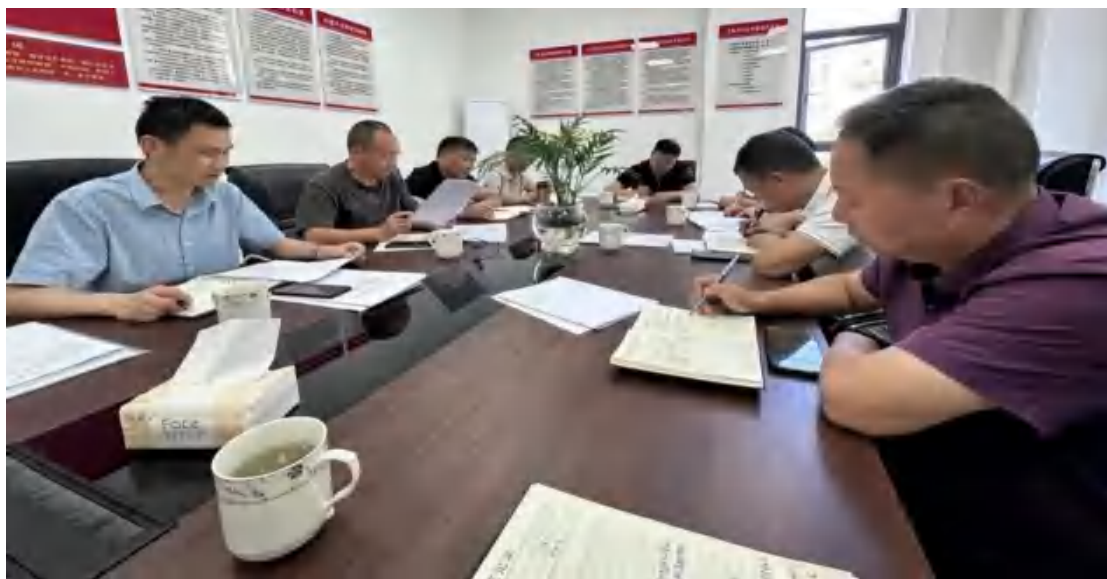
图92 平江县职业技术学校校委会研究审议过程