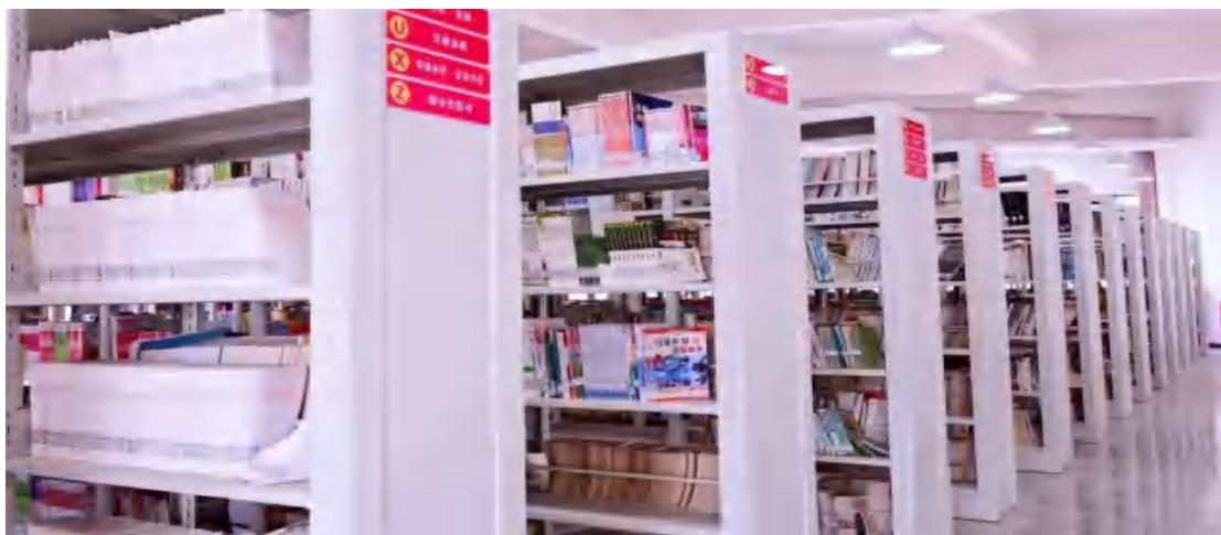
图93 图书馆二楼阅览区

二楼：二楼教师阅览区60席静谧雅座；学生电子阅览区配备60个机位，结合围栏外侧50个座位与书架旁18个阅读位，为数字化学习与传统阅读提供多，传统与数字阅读双轨并行。你喜欢的阅读方式，这里都有。