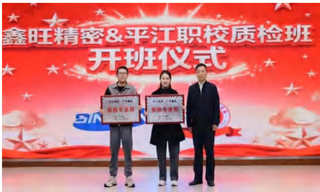
图90 “鑫旺质检班”开班仪式