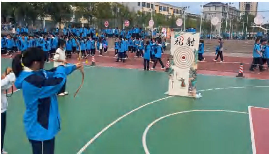
图76 金秋游园活动现场一

金秋游园活动： 为丰富学生校园文化生活，打破不同专业、年级学生的交流壁垒，同时展现中职教育“以技育人”的特色，结合秋日自然氛围与校园活动需求，为师生搭建轻松互动、展示技能、共享欢乐的平台。