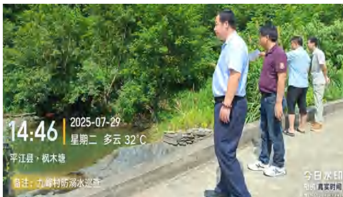
图54 开展到村调研工作座谈会