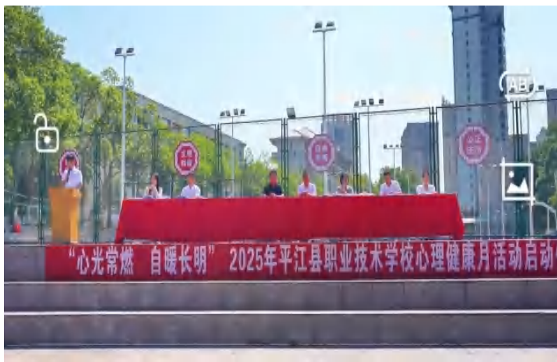
图20 心理健康月活动

活动后期评选优秀心理委员、“活力班级优秀奖” 及优秀主题黑板报，树立榜样。此次活动验证了多样化教育形式的有效性，学生释放压力、增强认知，教师缓解压力、凝聚合力，家长提升重视度，形成家校共育良好局面，其形式多样、家校联动的特色值得借鉴。