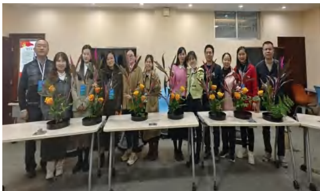
图24 组织教师赴湖南农大进行劳动课程学习

模式成效显著：近五年学生参与义工活动 100 余场次，本科升学率连续五年全省前列，获国家级技能大赛奖 5 项；投入近 50 万建成 3 个高标准实践基地，开发 40 门在线课程，培养省级名师 5 人，教师获多项国家级、省级奖项；模式被省内外学校借鉴，相关文章获专题报道，为县域中职教育转型提供“平江范式”。