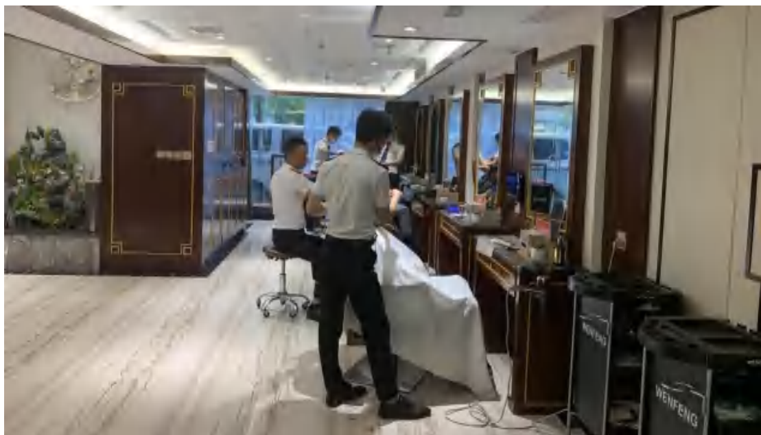
图88 文峰班学生实训