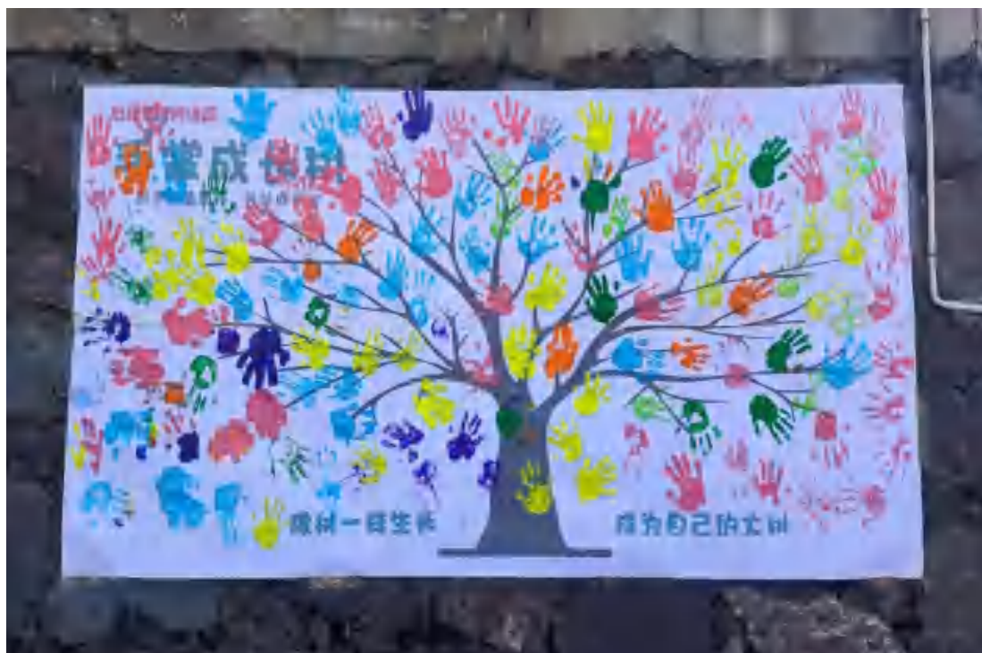
图21 学生心理活动作品展示