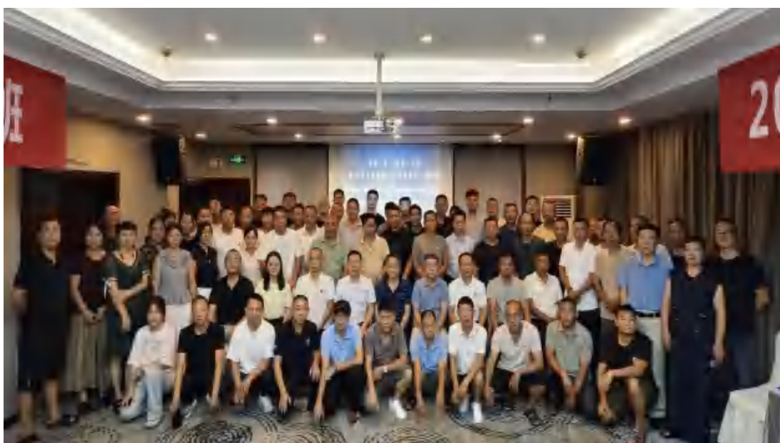
图 59 养殖培训现场

培训结束后 1 个月后调查，已有 12 名学员成功应用所学技术优化养殖流程，饲料成本平均降低 8%；3 家学员企业引入新媒体营销模式，产品订单量增长 15%；参训带头人带动周边 50 余户养殖户改进养殖方法。