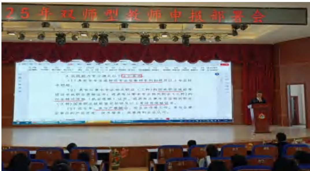
图30 双师型教师申报部署会现场

整个认定工作通过宣传动员、个人申报和学校初审和专家评议等环节，最终确定了校级“双师型”教师的认定名单，包括8位高级、39位中级、53位初级“双师型”教师。岳阳市中等职业教育“双师型”教师认定评审工作小组评定高级8人、中级38人、初级51人。