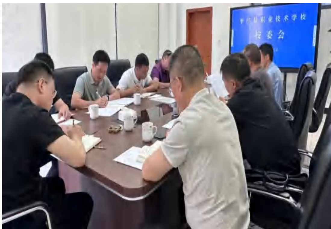
图91 平江县职业技术学校校委会全景图

平江县职业技术学校全面落实“三重一大”决策制度，出台《平江县职业技术学校“三重一大”制度实施办法》，对重大事项决策、重要干部任免、重要项目安排及大额资金使用等核心事务实行集体研究、民主决策，推动决策过程向民主化、科学化、制度化方向持续迈进。具体操作流程为：由各职能部门负责人提出“三重一大”待议事项，经分管领导审核确认后，填写《“三重一大”待议事项呈报表》报校长审阅；校长批复同意后，提交校委会集体研究审议；审议通过的议定事项，严格依照政策法规和制度要求推进实施。