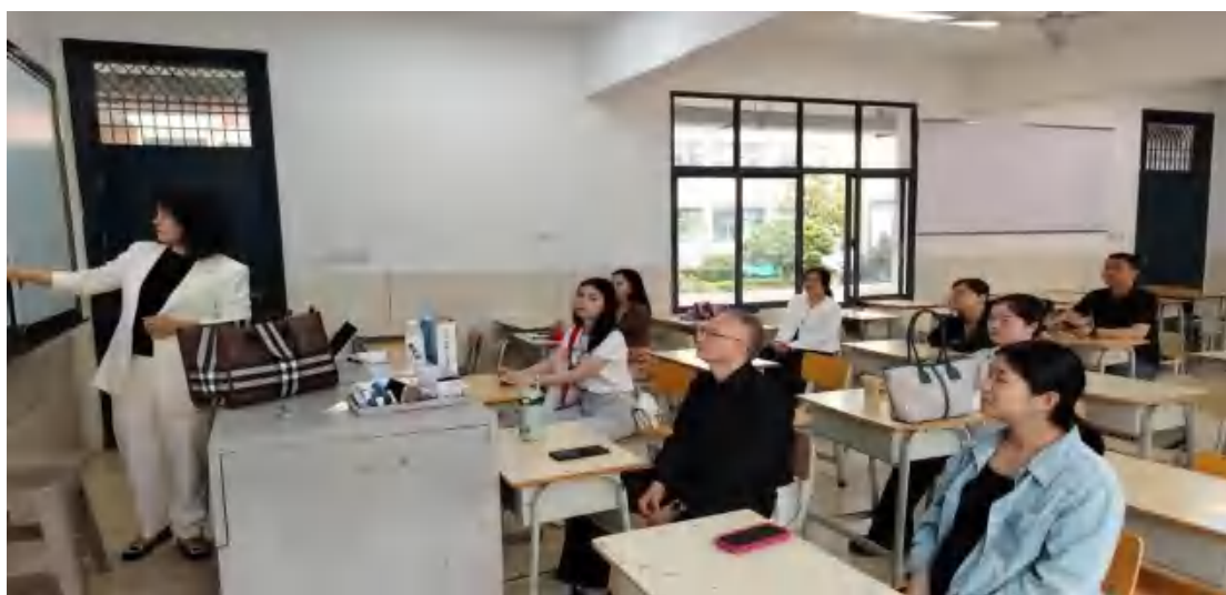
图 39 教师培训交流现场