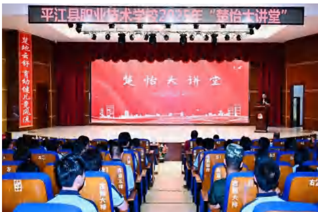
图66 楚怡大讲堂活动现场

5月16日上午，平江职校综合实训楼学术报告厅以“匠心筑梦，职通未来”为主题的2025年职业教育活动周楚怡大讲堂“工匠进校园”活动圆满举行，食品加工工艺、数控技术应用等专业师生与行业大咖面对面交流。